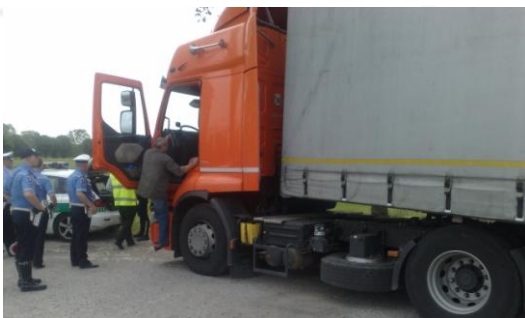
Controlli Polizia Locale di Gorgonzola (MI)

La possibilità di impostare e di personalizzare tutti i principali parametri lo rendono un prodotto flessibile per rispondere alle specifiche esigenze delle singole forze di Polizia.