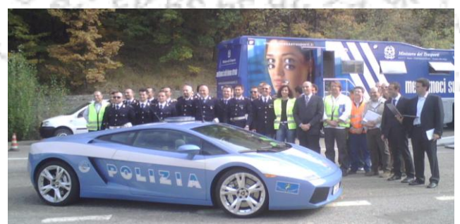
Controlli Polizia di Stato e Ministero dei Trasporti a Pian del Voglio